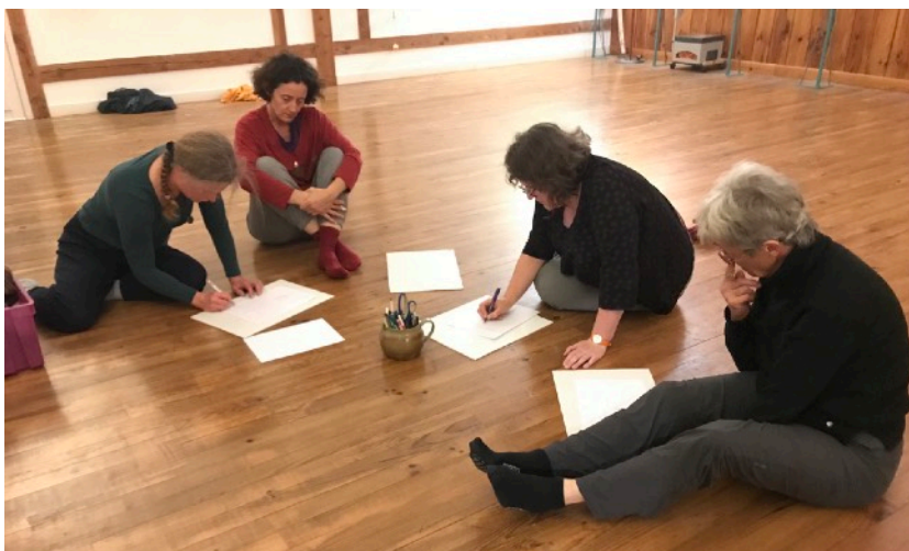
Groupe d'enseignantes en atelier

Les activités de réflexion et de recherche sur le sujet de l'écriture se poursuivent dans trois directions